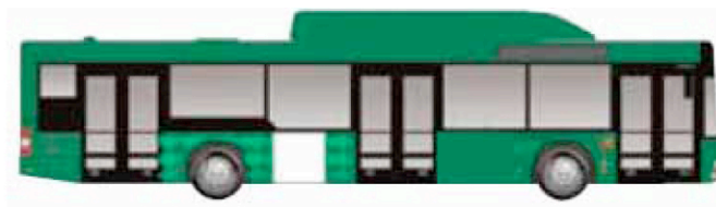
* Påstigning/ Kvadrat